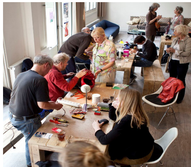
Abb. 1: Einblick in ein Repair Café

Die Durchführung einer Reparatur-Veranstaltung ist hinsichtlich Organisation, Ausstattung und Durchführung nicht aufwendig, es besteht die Möglichkeit Repair Cafés auch in Gemeinschaftsräumen umzusetzen bzw. zu praktizieren. Für Wohninitiativen kann sich dies als ein Kernelement des Nutzenversprechens der gemeinschaftlichen Aktivitäten erweisen. Für Wohnungsunternehmen kann die Ausrichtung von Repair Cafés ein Alleinstellungsmerkmal und einen Schlüssel zur Erreichung neuer Zielgruppe und zur Stärkung der Wettbewerbsposition im lokalen Umfeld darstellen.